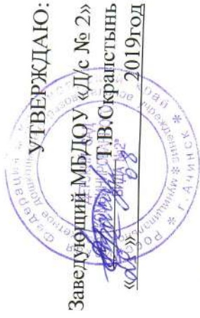
График проведения утренней гимнастики в МБДОУ «Д/с № 2» на 2019-2020 учебный год (первое полугодие) (физкультурный зал)